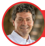
PAULO BUFALO PSOL RELATOR